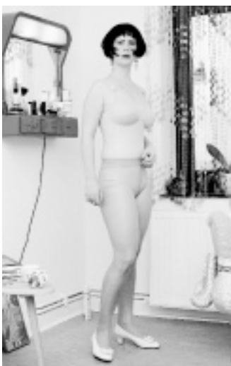
Tuntens privat: zu Hause fotografiert von Paula Winkler.